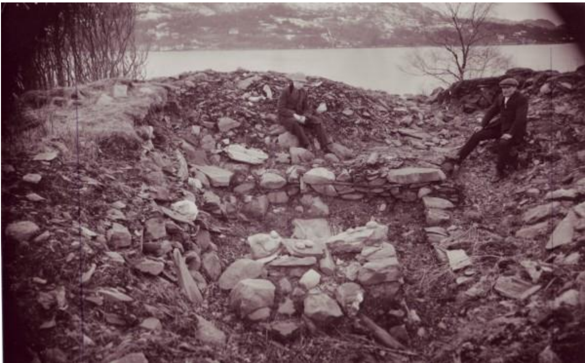
Frå utgravinga av det førhistoriske anlegget på Todneset 1915.