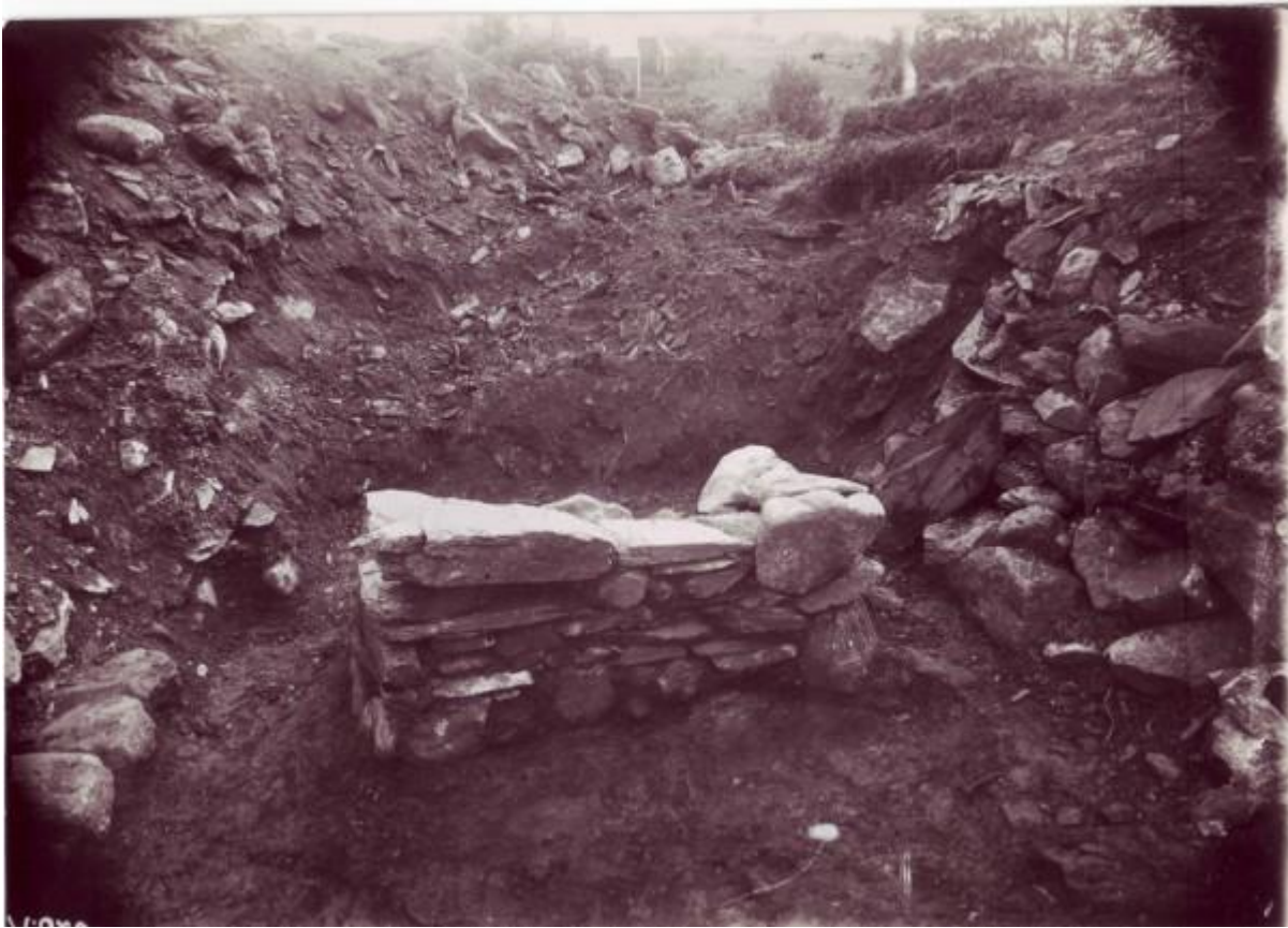
Her ser ein tydeleg "altaret" som kom fram under utgravinga.

Ein meir presis definisjon av kva eit horg er kan kanskje vera på sin plass. Eit horg er ganske enkelt ei mindre utgåve av eit hov. Horget høyrde garden til, det var til "privat bruk", medan hovet tente heile lokalsamfunnet. I dei aller tidlegaste tider kan horget berre ha vore ein stor stein e.l.l. under open himmel. Det var gjerne dei eldre kvinnene på garden som stod for utføringene av ritene, vert det hevda - men det er slikt ein trur og veit lite om.