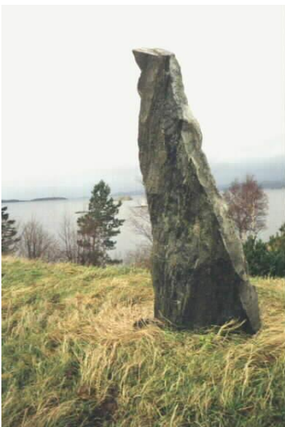
Bautasteinen på Todneset, slik den står i dag.